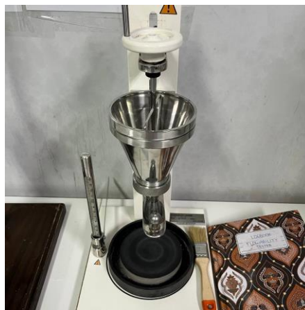
Gambar 5. Evaluasi Sifat Alir Granul Ekstrak Daun Pepaya California

Pengujian sifat alir menunjukkan bahwa semua formula menghasilkan waktu alir dibawah 10 detik sehingga memenuhi persyaratan sifat alir yang baik. Formula F0 memiliki kecepatan alir tertinggi sebesar 5,19 g/detik, sedangkan formula F2 menunjukkan nilai terendah sebesar 3,32 g/detik. Hasil uji ANOVA menunjukkan adanya perbedaan signifikan antar formula ( p < 0,05 ), yang menunjukkan bahwa variasi komposisi memengaruhi sifat fisik granul. Meskipun demikian, seluruh formula masih memiliki kemampuan alir yang cukup baik untuk proses pengisian kapsul. Setelah dilakukan cycling test, terjadi peningkatan waktu alir pada seluruh formula yang menunjukkan penurunan sifat alir akibat pengaruh suhu dan kelembapan selama penyimpanan (Wahyu, 2026).