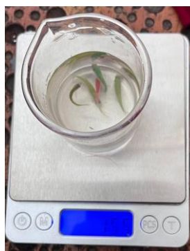
Gambar 9. Pertumbuhan Berat Badan Pada Ikan Zebra

Hasil penelitian mengonfirmasi bahwa pemberian kapsul ekstrak daun pepaya California memberikan pengaruh positif terhadap pertumbuhan zebrafish. Analisis ANOVA menghasilkan nilai signifikansi p < 0,05 , yang menegaskan adanya perbedaan bermakna antar kelompok perlakuan dalam hal peningkatan berat badan ikan. Kelompok F3 menunjukkan rata-rata pertumbuhan tertinggi dibandingkan kelompok lainnya, sehingga dapat diduga bahwa formulasi pada F3 mampu meningkatkan efisiensi metabolisme dan pemanfaatan nutrisi secara lebih optimal.