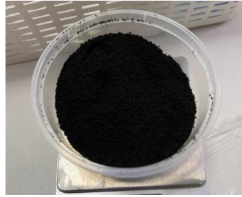
Gambar 3. Ekstrak Kering Daun Pepaya California