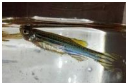
Gambar 2. Zebrafish ( Danio rerio ) (Dewi et al., 2024).

Untuk meningkatkan stabilitas bahan aktif sekaligus kenyamanan bagi pengguna, ekstrak daun pepaya California dapat diformulasikan ke dalam bentuk sediaan kapsul. Kapsul sebagai salah satu bentuk sediaan padat mampu memberikan perlindungan terhadap zat aktif dari berbagai faktor degradasi lingkungan seperti paparan udara, cahaya, dan kelembapan, sekaligus menjamin ketepatan dan konsistensi dosis yang diberikan (Ansel et al., 2011). Selain itu, bentuk kapsul dapat menutupi rasa pahit dan aroma khas dari bahan herbal sehingga lebih mudah diterima oleh pengguna. Penelitian terdahulu oleh Feronia et al. (2022) telah menunjukkan bahwa kapsul berbahan dasar ekstrak daun pepaya memenuhi standar sifat fisik dan stabilitas sesuai ketentuan farmakope. Namun demikian, penggunaan ekstrak dari varietas pepaya California dalam bentuk kapsul sebagai suplemen penambah nafsu makan masih sangat terbatas diteliti, terlebih dalam konteks pengujian menggunakan hewan model zebrafish.