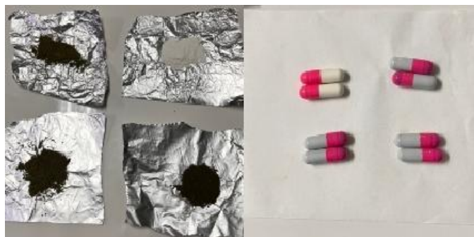
Gambar 4. Kapsul Ekstrak Daun Pepaya California

Pengamatan organoleptik menunjukkan bahwa formula F1, F2, dan F3 berwarna hijau dengan aroma khas perpaduan daun pepaya dan teh, sementara formula F0 tampak berwarna putih dengan aroma khas sediaan obat. Perbedaan tersebut dipengaruhi oleh penambahan ekstrak daun pepaya California pada formula perlakuan. Pada sediaan kapsul, seluruh formula menunjukkan bentuk dan tampilan yang relatif seragam, sehingga menunjukkan proses pengisian kapsul berlangsung baik. Penggunaan cangkang kapsul juga mampu menutupi rasa dan aroma khas ekstrak daun pepaya sehingga meningkatkan kenyamanan penggunaan sediaan (Ansel et al. , 2011).