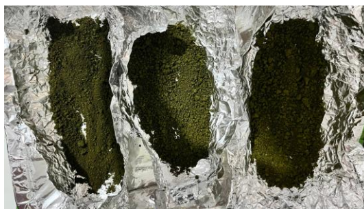
Gambar 7. Evaluasi Susut Pengerinan Granul Ekstrak Daun Pepaya California

Formula F2 menunjukkan nilai LOD paling rendah, yang berarti memiliki kadar air terkecil dan tingkat kekeringan terbaik di antara semua formula. Sebaliknya, F1 dan F3 menunjukkan nilai LOD tertinggi ( >11\% ) yang mengindikasikan kadar air granul masih cukup tinggi. Kadar air yang tinggi dapat menyebabkan granul menjadi lembap, mudah menggumpal, serta menurunkan kemampuan alir granul saat proses pengemasan (Annisa, 2020).