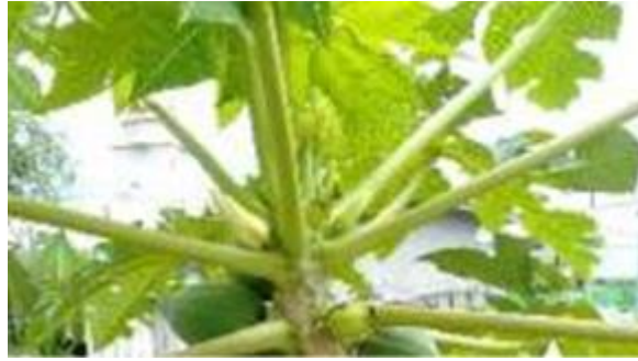
Gambar 1. Pepaya California ( Carica papaya L.) (Wardoyo et al., 2024).

Untuk meningkatkan stabilitas bahan aktif sekaligus kenyamanan bagi pengguna, ekstrak daun pepaya California dapat diformulasikan ke dalam bentuk sediaan kapsul. Kapsul sebagai salah satu bentuk sediaan padat mampu memberikan perlindungan terhadap zat aktif dari berbagai faktor degradasi lingkungan seperti paparan udara, cahaya, dan kelembapan, sekaligus menjamin ketepatan dan konsistensi dosis yang diberikan (Ansel et al., 2011). Selain itu, bentuk kapsul dapat menutupi rasa pahit dan aroma khas dari bahan herbal sehingga lebih mudah diterima oleh pengguna. Penelitian terdahulu oleh Feronia et al. (2022) telah menunjukkan bahwa kapsul berbahan dasar ekstrak daun pepaya memenuhi standar sifat fisik dan stabilitas sesuai ketentuan farmakope. Namun demikian, penggunaan ekstrak dari varietas pepaya California dalam bentuk kapsul sebagai suplemen penambah nafsu makan masih sangat terbatas diteliti, terlebih dalam konteks pengujian menggunakan hewan model zebrafish.