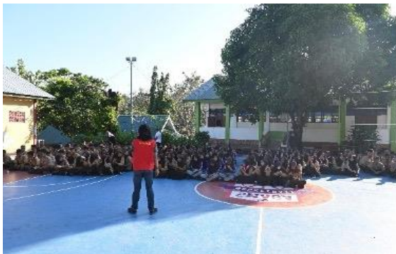
Gambar 3. Sesi Tanya Jawab.