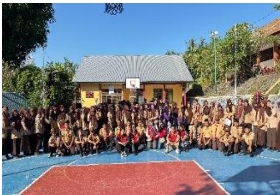
Gambar 5. Foto bersama Siswa dan Guru.