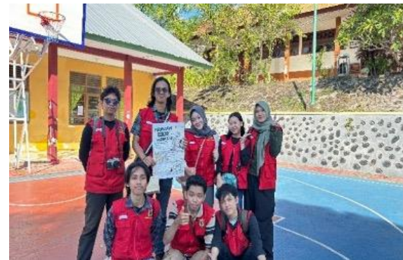
Gambar 4. Penyerahan Poster.