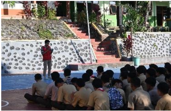
Gambar 1. Pembukaan Moderator.