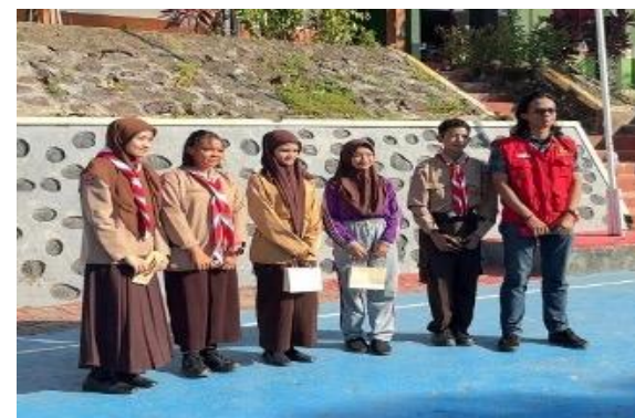
Gambar 6. Pemberian Hadiah.