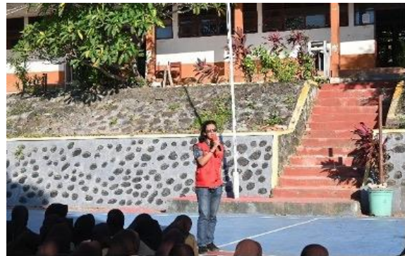
Gambar 2. Pemaparan Materi.